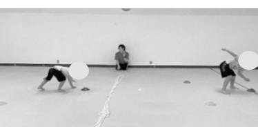
【ビジョン・協調運動】