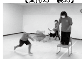
【スピード・瞬発力】